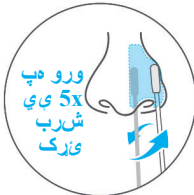
ورو ډیپ 5x ی ی شرب ټی ټک