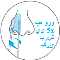
ورو ډیپ 5x ی ی شرب ټی ټک