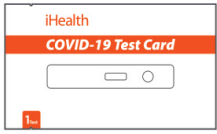
د ډک ډروڅک ډیپ وی ټی وی و مزاد 19-ډی و وک تراک