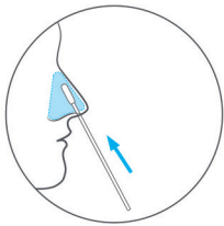
رت چنای هوی د یروپ ی ص ح 4/3