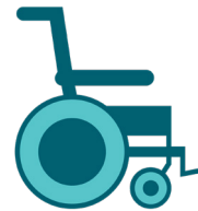
инвалидных колясок и ходунков