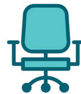
столов и стульев