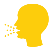
หายใจลำบาก