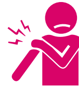
Xanuun ah goobtii lagaa muday

Dad badani waxa ay ku yeeshaan xanuun waxoogaaya gacanta halkii ay ka qaateen tallaalka. Daal iyo madax xanuun iyaguna sidoo kale aad ayaa u badan yihiin. Waxa iyagu iska yar muruq xanuunka, xanuunka laabatooyinka, matagga, ama xummadda. Saamaynahan xunxuni badanaa waa ay baaba'aan ka dib maalin ama laba. Haddii ay kaa baabi'i waayaan, wac dhakhtarkaaga. Haddii aanad lahayn dhakhtar, wac 211.